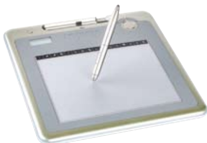
mimio ® vous permet de contrôler votre système dans l'enceinte de la salle