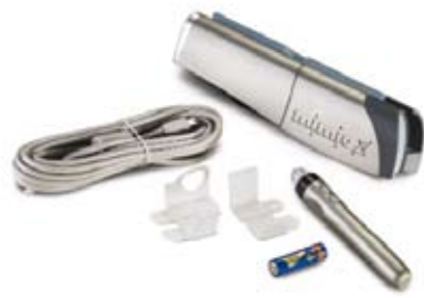
mimio ® Interactive, mimio ® Mouse, câble USB (5 m), pile pour mimio ® Mouse, supports de montage