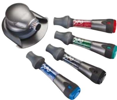
mimio ® Capture enregistre numériquement le marqueur effaçable à sec