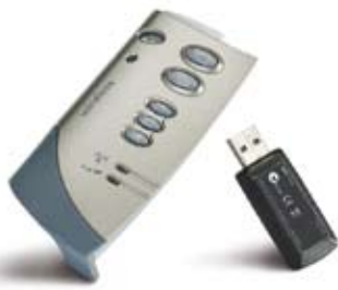
mimio ® Wireless et récepteur USB